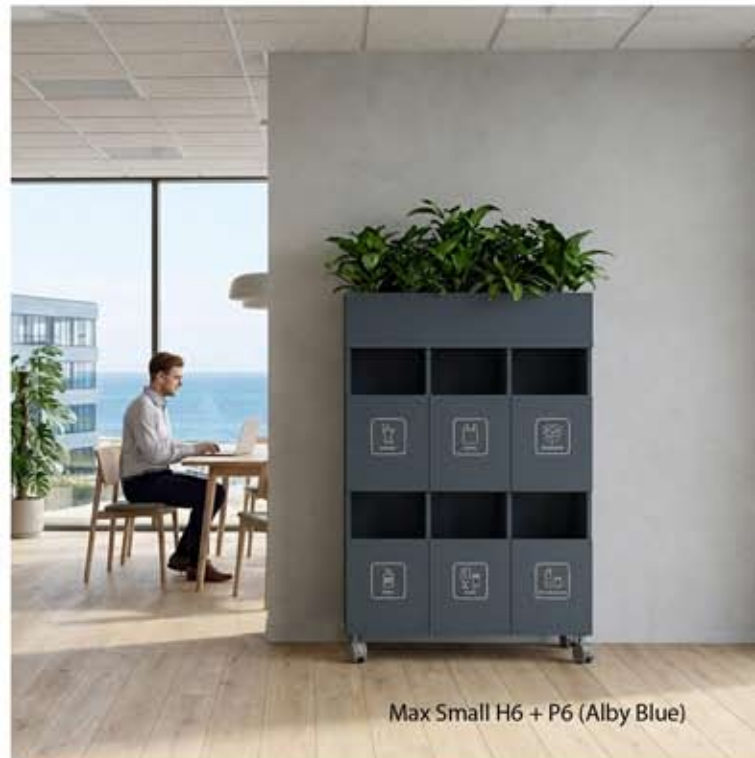
Max Small H6 + P6 (Alby Blue)

Laajan värivalikoiman ansiosta voit luoda omaan tyyliin ja sisustukseen sulautuvan yhdistelmän. Kierrätysymbolit ovat saatavilla sekä suomeksi että englanniksi mustana tai valkoisena. Lajittelukalusteessa on kalustepyörät, joiden avulla sitä on kätevää siirrellä tarpeen tullen. Voit myös pristää tilasi yleisilmettä kasvilaatikolla ja viherkasveilla.