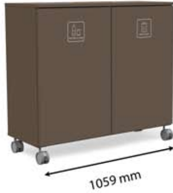
L-L2 (2 x 150 L)