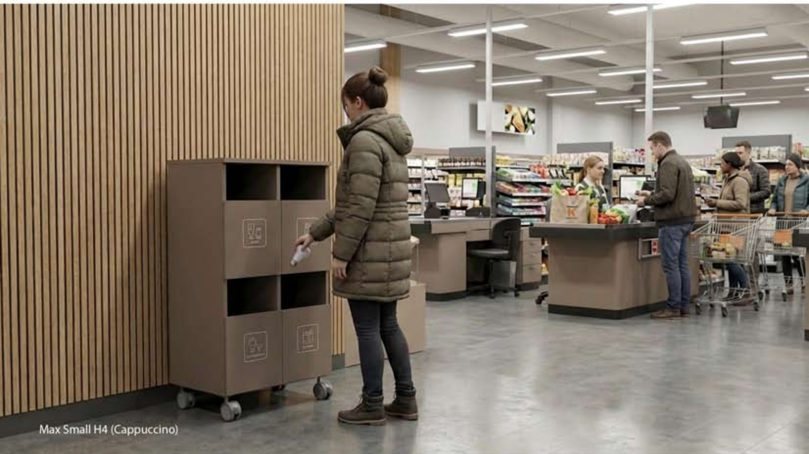
Max Small H4 (Cappuccino)