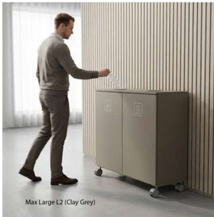
Max Large L2 (Clay Grey)

Laajan värivalikoiman ansiosta voit luoda omaan tyyliin ja sisustukseen sulautuvan yhdistelmän. Kierrätysymbolit ovat saatavilla sekä suomeksi että englanniksi mustana tai valkoisena. Lajittelukalusteessa on kalustepyörät, joiden avulla sitä on kätevää siirrellä tarpeen tullen.