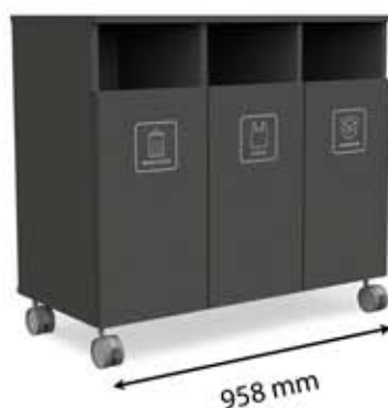
M-H3 (3 x 45 L)