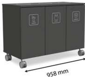
M-L3 (3 x 45 L)