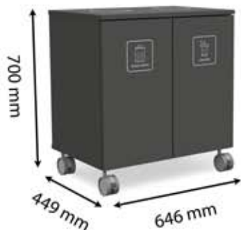
M-L2 (2 x 45 L)