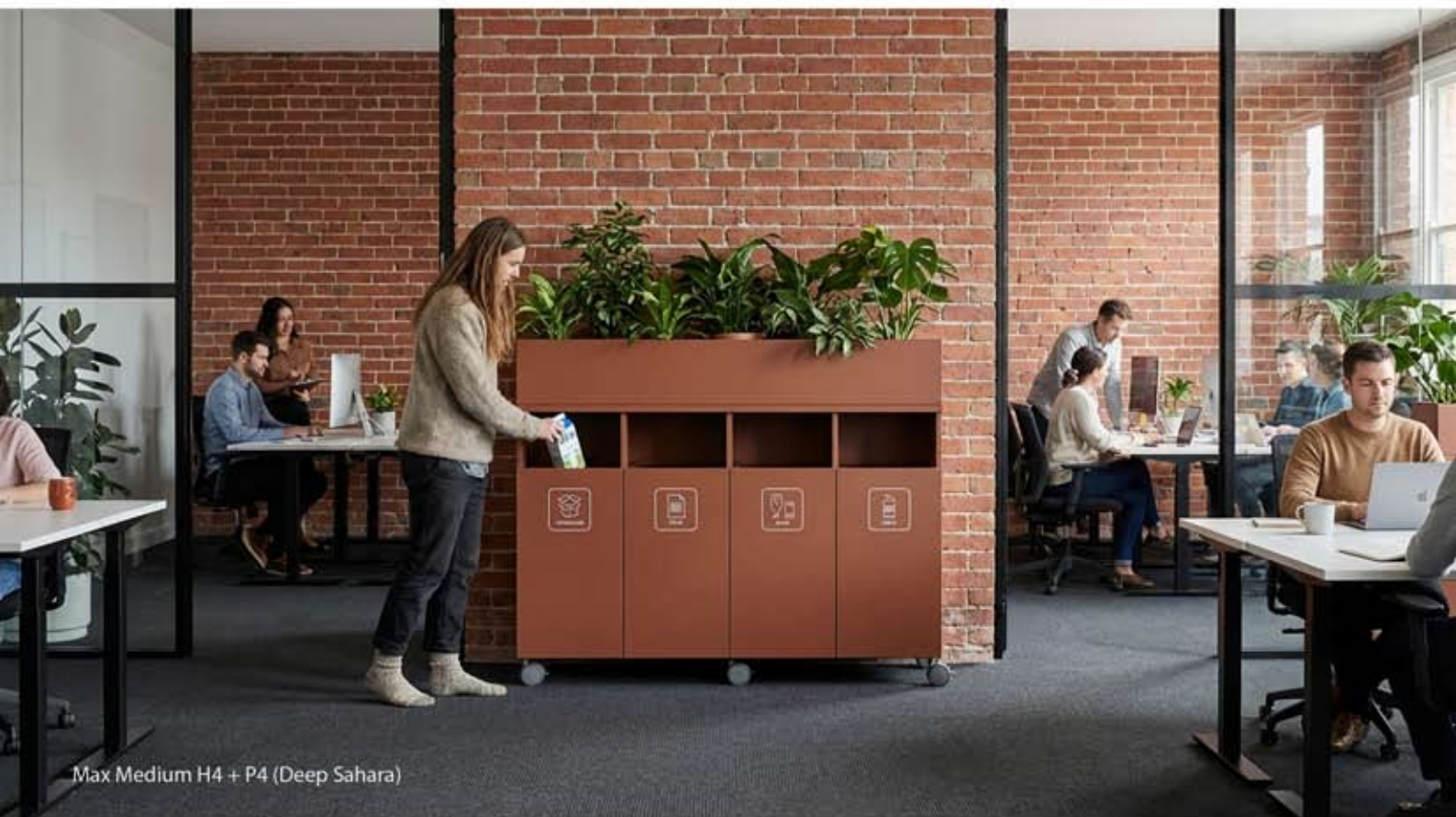
Max Medium H4 + P4 (Deep Sahara)