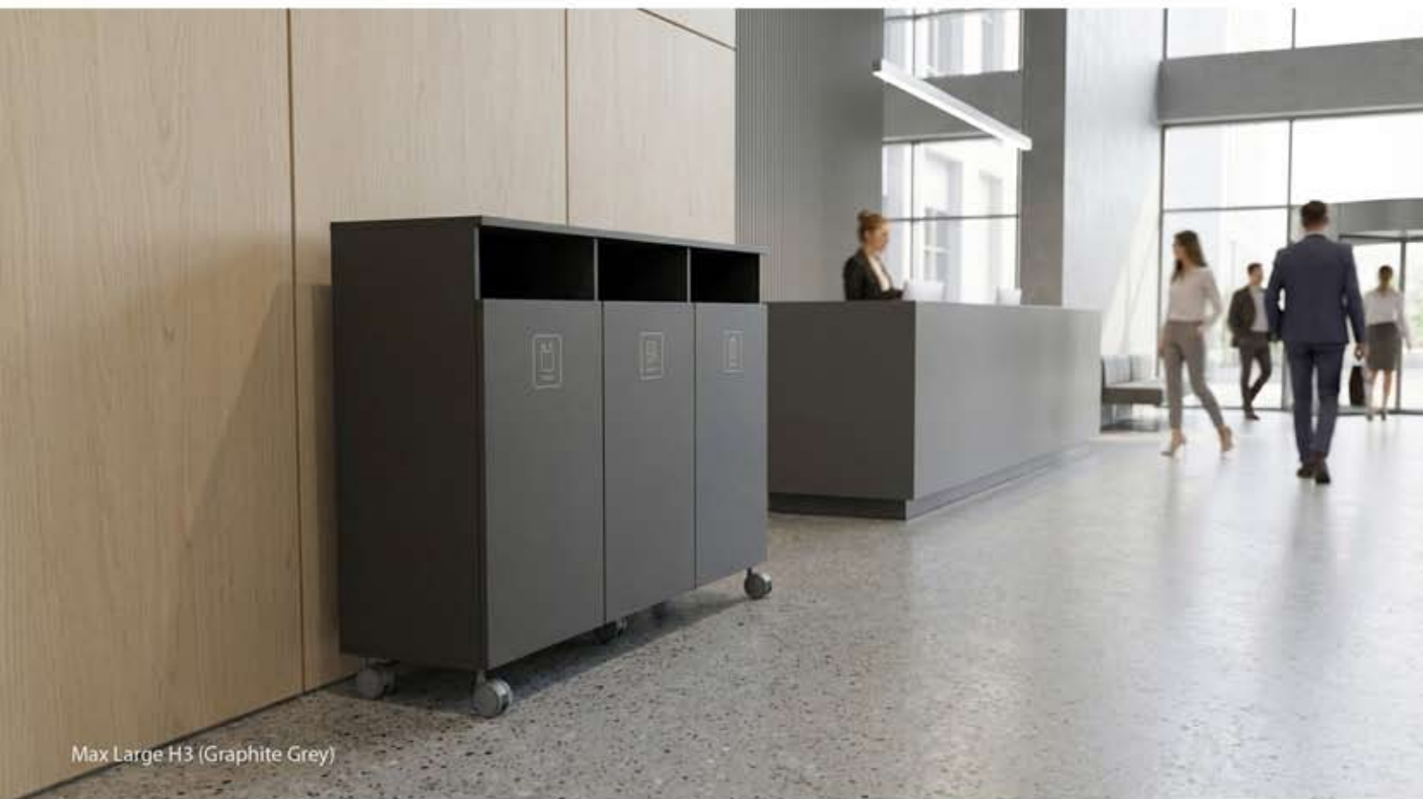
Max Large H3 (Graphite Grey)