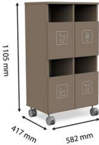
S-H4 (4 x 21 L)