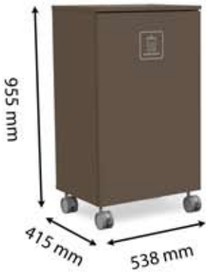
L-L1 (150 L)