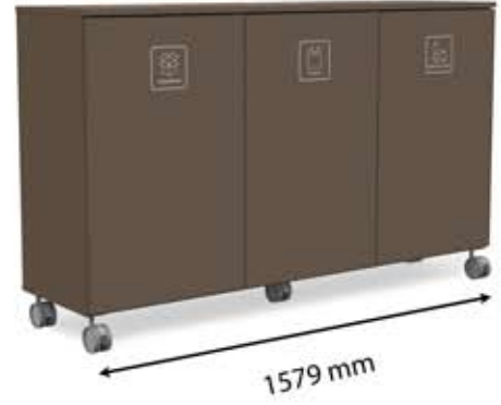
L-L3 (3 x 150 L)