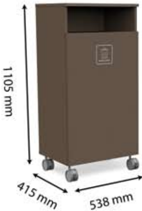
L-H1 (150 L)