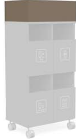
S-P6 (55 L)