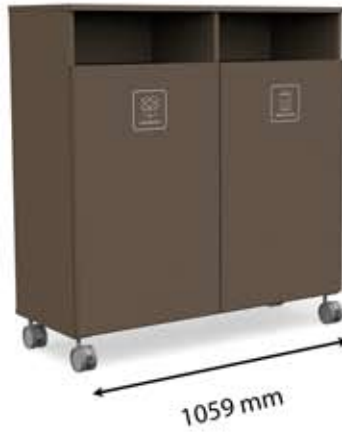
L-H2 (2 x 150 L)