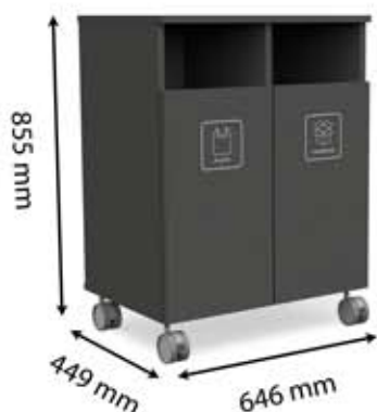
M-H2 (2 x 45 L)