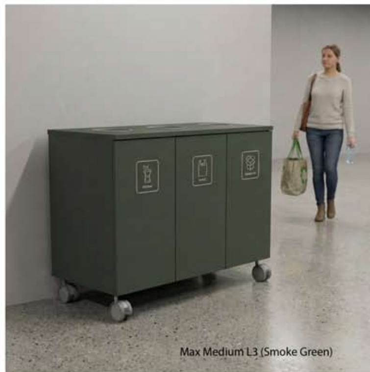
Max Medium L3 (Smoke Green)

Laajan värivalikoiman ansiosta voit luoda omaan tyyliin ja sisustukseen sulautuvan yhdistelmän. Kierrätysymbolit ovat saatavilla sekä suomeksi että englanniksi mustana tai valkoisena. Lajittelukalusteessa on kalustepyörät, joiden avulla sitä on kätevää siirrellä tarpeen tullen. Voit myös piristää tilasi yleisilmettä kasvilaatikolla ja viherkasveilla.