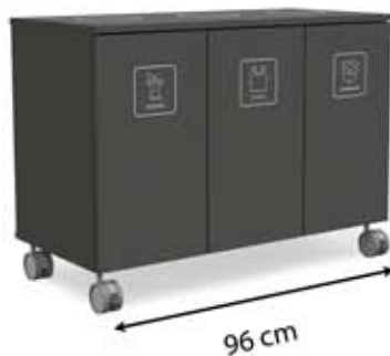
M-L3 (3 x 45 L)