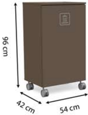
L-L1 (150 L)