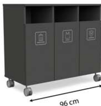
M-H3 (3 x 45 L)