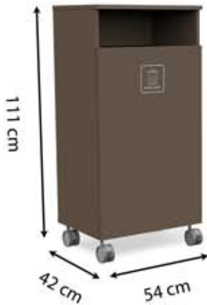
L-H1 (150 L)