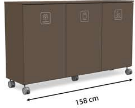
L-L3 (3 x 150 L)