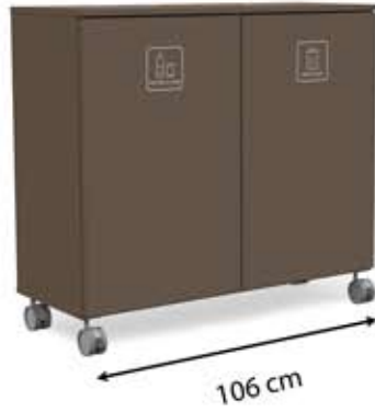
L-L2 (2 x 150 L)