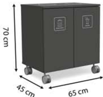
M-L2 (2 x 45 L)