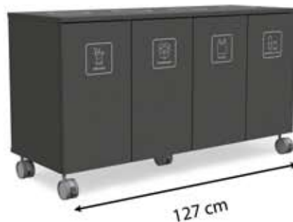
M-L4 (4 x 45 L)