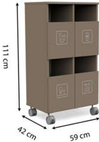
S-H4 (4 x 21 L)