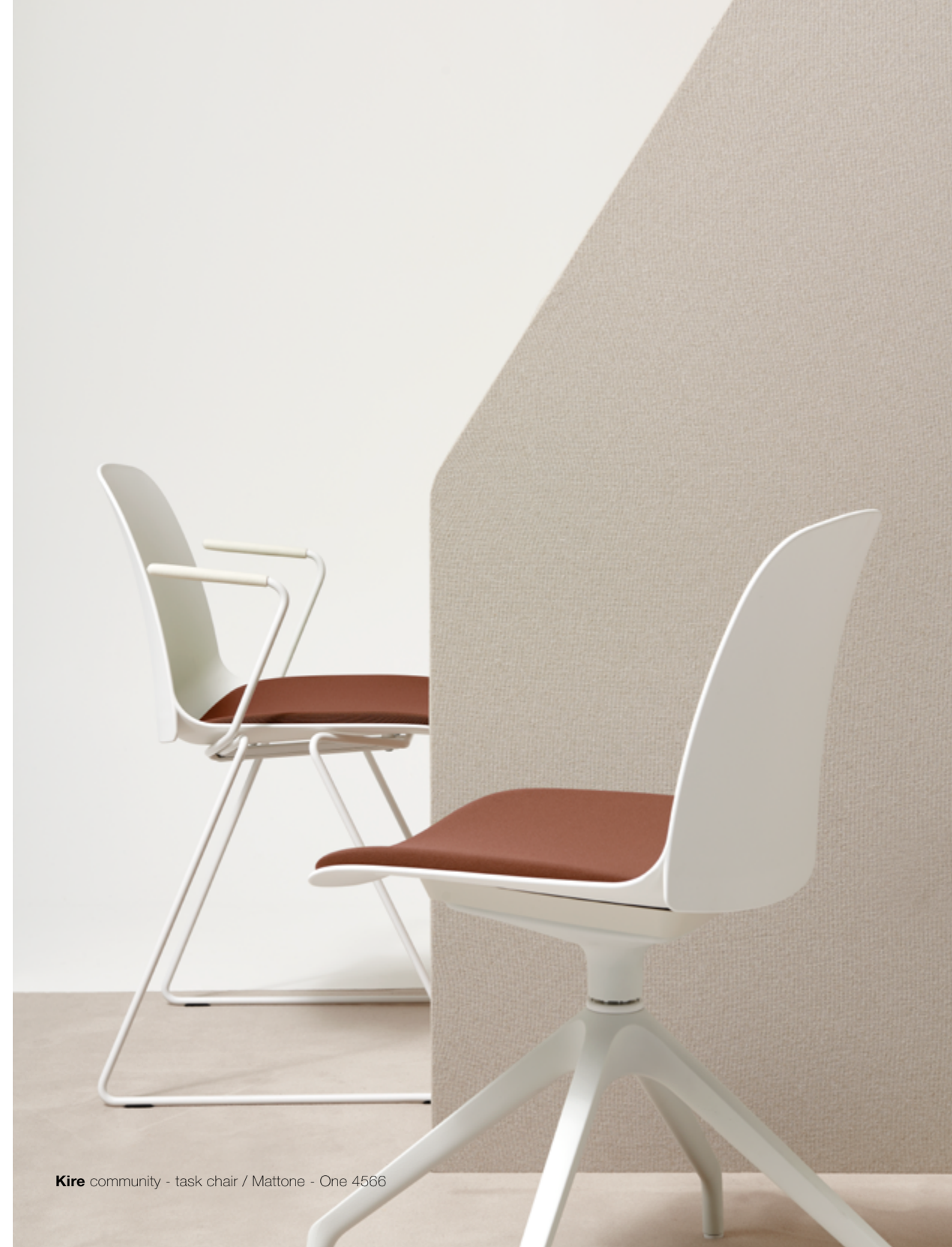
Kire community - task chair / Mattone - One 4566