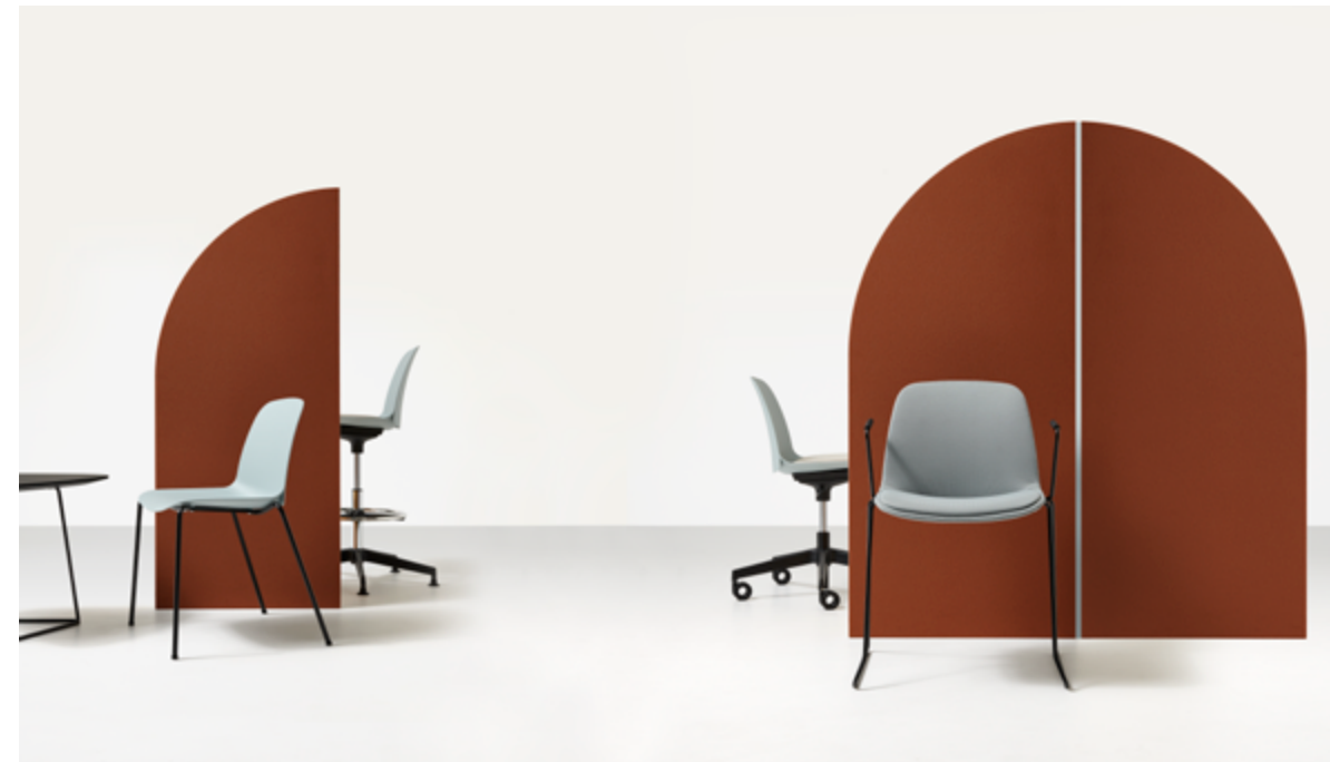
Kire visitor chair / Azzurro - One 8032