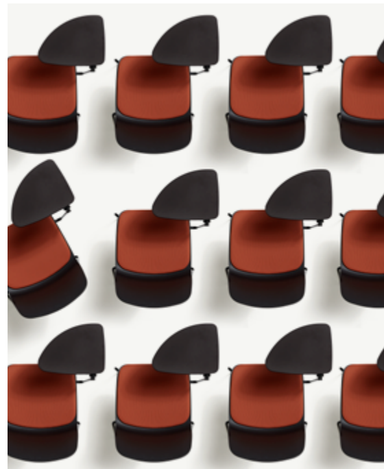
Kire community chair / Nero - One 4566