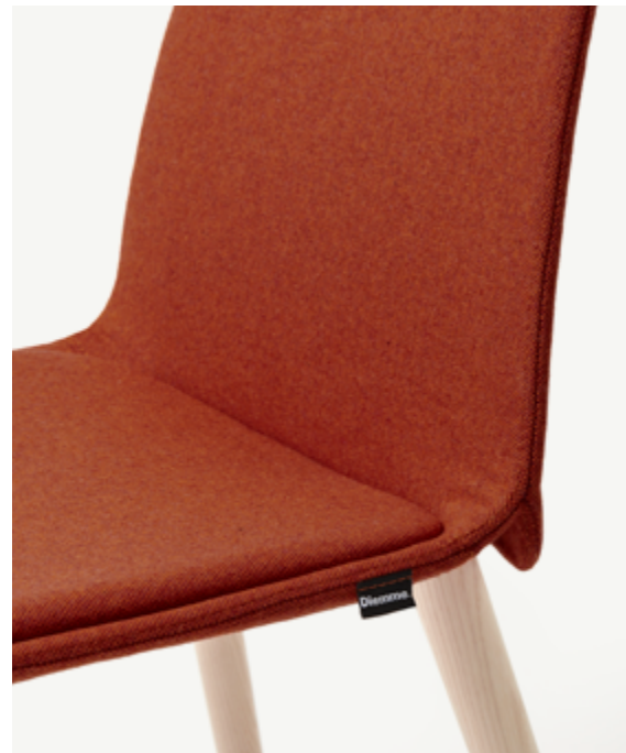
Kire visitor chair / Wolin 7050.36